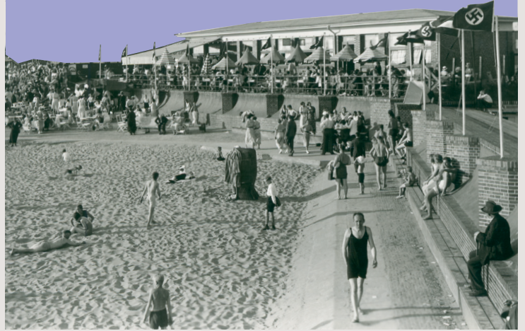
Weserbad 1935. Ab dem 25. Juli 1935 verbietet ein Schild am Eingang des Bades Jüdinnen:Juden den Zutritt.

Für den Tag der Stadtgeschichte forschen seit 2015 jedes Jahr abwechselnd etwa 150 Schüler:innen der Schulzentren Carl von Ossietzky und Geschwister Scholl sowie des Lloyd Gymnasiums zu 50 Orten und Biografien der Stadt während der Zeit des Nationalsozialismus (NS) und vermitteln dies an 1500 Schüler:innen und die interessierte Öffentlichkeit.