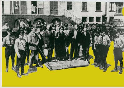
1.3 Marktplatz, 6. Mai 1933. Die SA verbrennt – begleitet von Marschmusik und Gesängen von NSDAP, Hitlerjugend und Zuschauer:innen – Fahnen, Plakate, Flugblätter und Bücher aus Gewerkschaftshäusern und von SPD und KPD.

August 1933. Wesermünder Kommunist:innen werden von Marine-SA-Männern dazu gezwungen, Friedensparolen im Fischereihafen mit Zahnbürsten und Schrubbern zu entfernen.